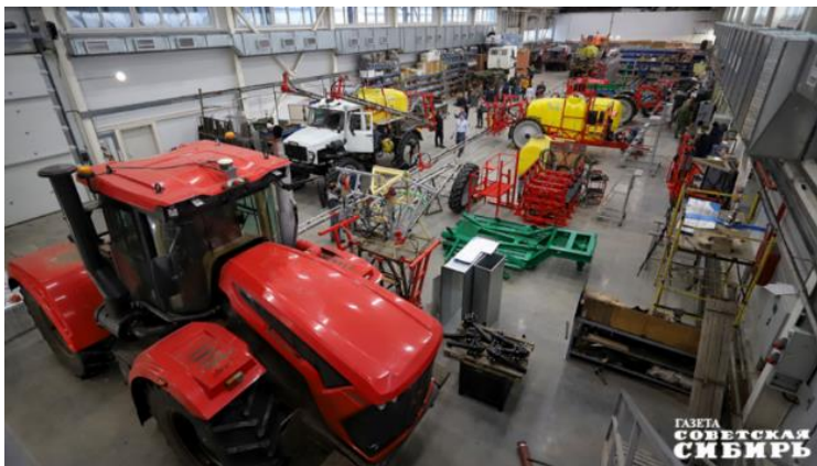
Обучение от центра занятости проходят либо по программам профессиональной переподготовки, либо по программам повышения квалификации или дополнительного профобразования. В первом случае выдается диплом о профпереподготовке, во втором — удостоверение о повышении квалификации, в третьем — сертификат или удостоверение.

На данный момент мощные образовательные программы для соискателей представляют не только колледжи, но и три крупных федеральных оператора — это Томский государственный университет, Российская академия народного хозяйства и государственной службы (РАНХиГС) и Институт развития профессионального образования.