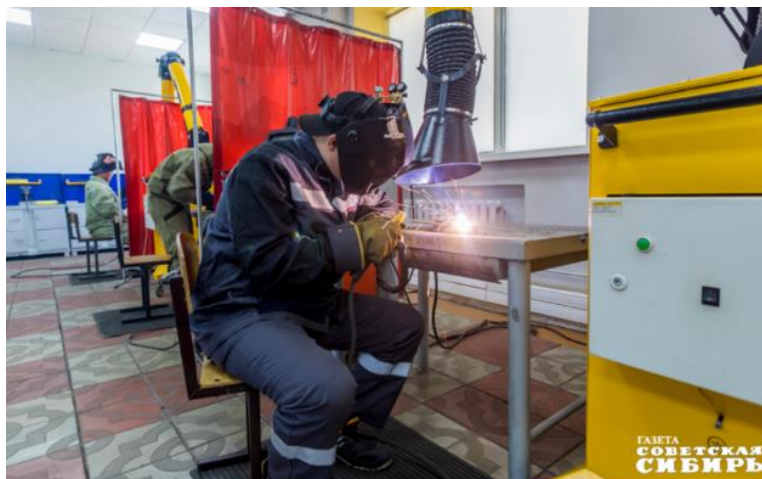
Наиболее востребованы сегодня рабочие профессии. Также можно освоить специальности программиста, бухгалтера, маркетолога, повара, водителя, мастера по ремонту техники и многие другие.