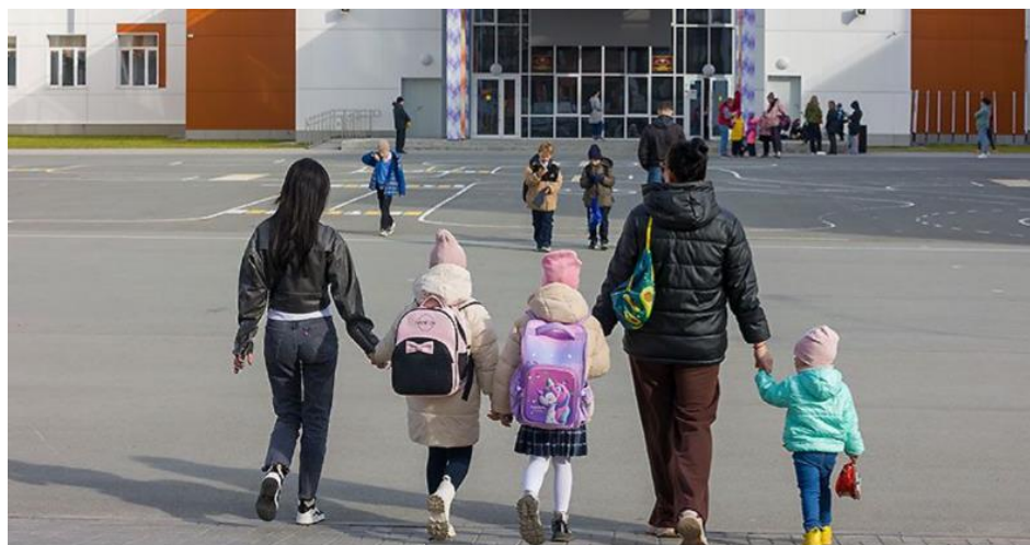
Сегодня в Новосибирской области действует 106 мер соцподдержки, из которых 21 мера направлена непосредственно на поддержку семей с детьми.

— В рамках цифровой трансформации, являющейся одной из национальных целей развития России, губернатор Андрей Травников поставил задачу как можно больше социальных услуг переводить не