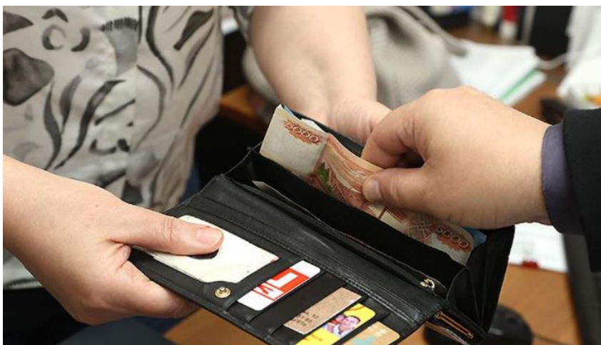
Самая крупная сумма, переведённая мошенникам в 2024 году, составила 6 млн рублей.