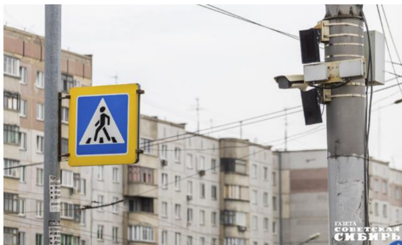
Сегодня продолжается работа по увеличению числа камер видеонаблюдения на улицах и не только.

— Благодаря в том числе инициативе депутатского корпуса по пожарным сигнализациям в прошлом году систему модернизировали в 248 образовательных организациях, — рассказал Сергей Цукарь. — Всего за период с 2019 по 2023 год модернизированы 465 образовательных организаций. За счет оперативной передачи информации с помощью этих датчиков в единые дежурно-диспетчерские службы, в оперативные службы пожарной охраны удалось спасти