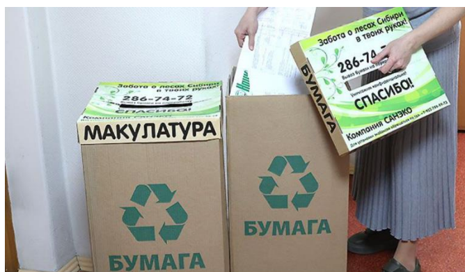
Редакция «Ведомостей» регулярно сдаёт макулатуру: мы — за осознанное потребление!

Где: ул. Танковая, 72, оф. 53 Контакт: 8-913-920-18-75