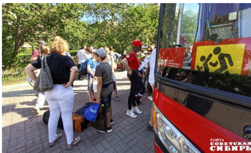
Прошлым летом в оздоровительных лагерях региона отдохнули более 121 тысячи детей. В планах региональных минтруда и минцифры до конца года перевести услугу по получению путевки в лагерь полностью в электронный вид — пока что лишь заявление можно подать на портале госуслуг.

В этом году «Карта жителя Новосибирской области» будет основательно доработана. У ее обладателей появятся новые возможности. Так, например, по словам замглавы регионального минцифры, сегодня разрабатывается электронный пропуск в виде QR-кода для посещения культурно-досуговых учреждений для многодетных,