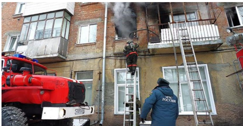
Если жильё уничтожено в результате несчастного случая, возникает право на получение жилого помещения по договору специализированного найма.

Жилищные права детей-сирот, детей, оставшихся без попечения родителей, и лиц из их числа закреплены Жилищным кодексом Российской Федерации и