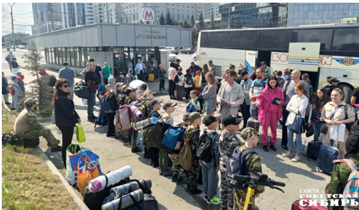
В День защиты детей свои двери распахнут многочисленные загородные оздоровительные лагеря — первая смена в них начнется с праздничных мероприятий.

С каждым годом набирает все большую популярность такая мера поддержки, как социальный контракт. Растет количество желающих его заключить, и, что особенно важно, в среднем подушевой доход граждан в семьях после заключения соцконтракта увеличивается на 50 процентов. При рождении детей семьи получают материнский капитал, размер которого составляет 631 тысячу рублей на первого ребенка, 834 тысячи на второго или последующего ребенка, а также областной семейный капитал в размере 146 тысяч рублей.