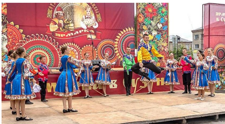
Работники культуры, переезжающие в село, смогут получить 1 млн рублей.

На 2025 год в России запланирован запуск программы «Земский работник культуры», которая будет действовать по аналогии с уже существующими для медиков и педагогов. Она призвана решить вопрос дефицита кадров в малых городах и на селе.