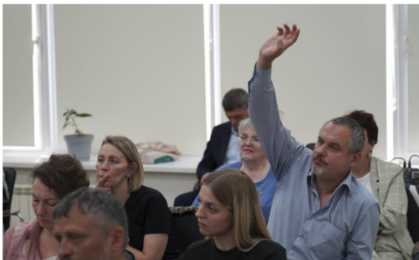
Некоммерческие организации повысили свою финансовую грамотность. Дом общественных организаций провел тематический семинар в рамках проекта «НКО 360».

Скажите, получить грант может не каждый? Да, это непростое дело требует подготовки и целеустремленности. И если идея хороша и явно ложится в русло интересов общества и государства, нужно начинать ее продвигать. Как? Об этом рассказываем.