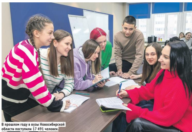
В прошлом году в вузы Новосибирской области поступили 17 491 человек.

Продолжить обучение часто хотят не только вчерашние выпускники, но и те, кто уже имеет за плечами определённый опыт. Кстати, так случилось и со мной. Шесть лет назад я получил диплом о среднем профессиональном образовании, и всё это время мне казалось, что этого будет достаточно. Однако время идёт, а человеческая натура такова, что нам всегда хочется расти и развиваться. Летом 2023 года я принял решение получить высшее образование. Говоря откровенно, вернуться в статус абитуриента спустя без малого 10 лет — не самое приятное ощущение. К тому же когда принятие решения о выборе специальности и подготовка к сдаче вступительных экзаменов перемешиваются с привычными житейскими делами, трудности кажутся бесконечными. Но даже при успешном прохождении этих этапов есть ещё один аспект, о котором мы не должны забывать, — оплата образования.