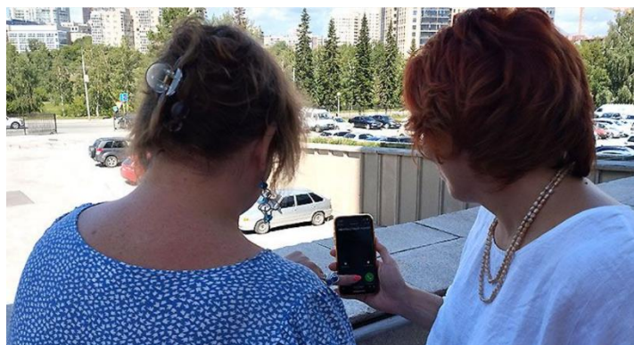
Схема не новая, но до сих пор активно эксплуатируемая мошенниками. С вами в мессенджере связывается «руководитель». В профиле именно его фото, он обращается к вам по имени-отчеству и сообщает, что случился какой-то форс-мажор и вам, как и прочим сотрудникам, надо пообщаться с представителем не-

кой важной контролирующей инстанции, который расскажет порядок действий, необходимых для решения проблемы. Как правило, в итоге всё сводится к выманиванию денег, персональных данных или другой конфиденциальной информации.