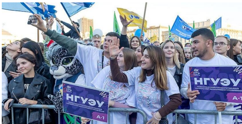
Трудовым законодательством установлены гарантии и компенсации работникам, совмещающим работу с получением образования.

Трудовым законодательством установлены гарантии и компенсации работникам, совмещающим работу с получением образования (гл. 26 Трудового кодекса Российской Федерации). Предусмотренные гарантии и компенсации предоставляются работникам при получении