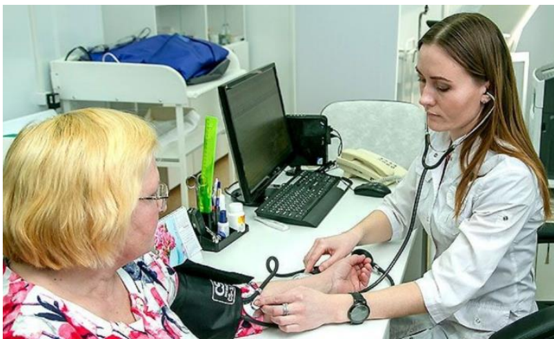
Сельские медработники получают не только денежные выплаты, но и другие льготы.

Врачи, медицинские сёстры, фельдшеры, акушерки, переезжающие на работу в сёла, посёлки и города с населением до 50 тысяч человек. Они должны заключить трудовой договор с государственной медицинской организацией о трудоустройстве на должность, включённую в программный реестр, утверждённый министерством здравоохранения НСО.